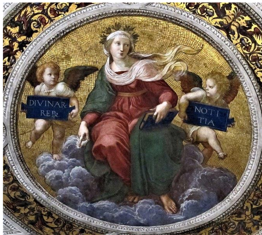
Ραφαήλ (1483-1520) Θεολογία 1509-1511, τοιχογραφία Βατικανό, Παπικά διαμερίσματα.