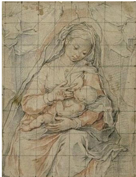
Salimbeni Ventura (1567-1613)