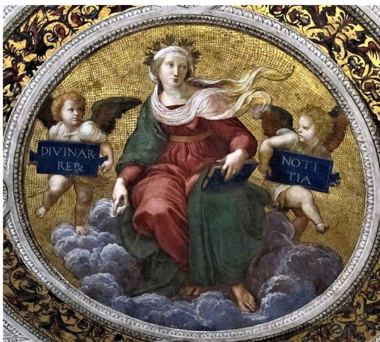
Ραφαήλ (1483-1520) Θεολογία 1509-1511, τοιχογραφία Βατικανό, Παπικά διαμερίσματα.