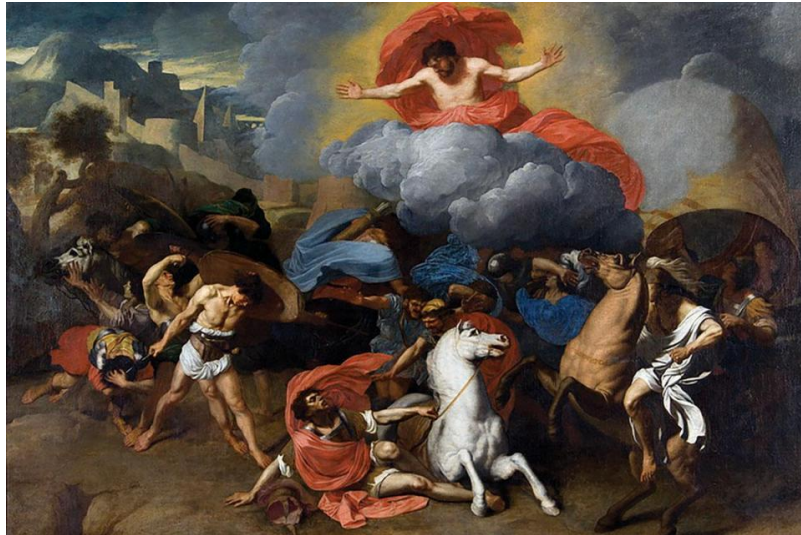
Bertholet Flemalle, Η μεταστροφή του Απ. Παύλου , Καθεδρικός Ναός Αγ. Παύλου, Λιέγη, Βέλγιο.