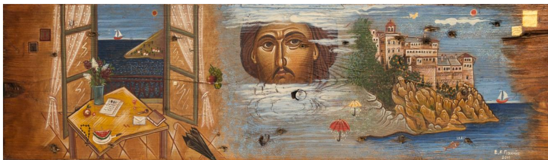
Ο Χριστός, η ελπίς ημών, πίνακας του αγιογράφου Στάθη Γιαννή (2011).

Το μήνυμα της ελπίδας που δώσαμε βρήκε την δέουσα ανταπόκριση; Στην απολογία ...της ελπίδας προέκυψε κάποιος απολογισμός ; Η ποιμαντική της ελπίδας απέδωσε κάποιους καρπούς; Δεν μπορεί, κάτι θα προέκυψε, έτσι ώστε να μη χρειαστεί να «επαναλάβουμε» την τάξη. Τουλάχιστον ας μέναμε μετεξεταστέοι!