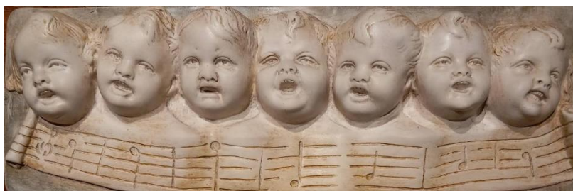
Η κλίμακα του ντο, αναπαρίσταται με 7 αγγελάκια. Υπάρχουν Κλίμακες και... κλίμακες!