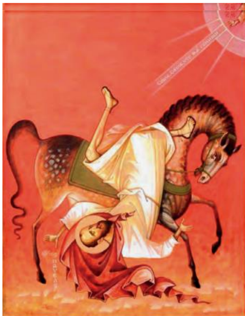
Oleg Shurkus, Η μεταστροφή του Απ. Παύλου.

Η μορφή του Αποστόλου Παύλου δεσπόζει στην ιστορία της Εκκλησίας και του Χριστιανισμού. Σημείο αφετηρίας η μεταστροφή του στο δρόμο για την Δαμασκό. Μπορούμε να πούμε ότι υπήρξε ένα σημείο χωρίς επιστροφή . Η στάση ζωής που ακολούθησε ήταν καθοριστική για την πορεία την δική του και της όλης Εκκλησίας. Σημαδεύει την ζωή μας και μας κάνει να αναρωτηθούμε ποια είναι τα καλά και συμφέροντα στα του βίου μας και η αξία του να ξεχνάμε αυτά που προηγήθηκαν και να ανοιγόμαστε σε αυτά που έρχονται (πρβλ. Φιλιππησίους 3, 14).