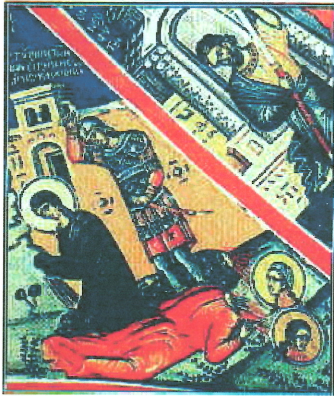
εικόνα 1 Μαρτύριο των αγίων Ειρήνης, Αγάπης και Χιονίας. (Μονή Φιλανθρωπινών 16 ος αιώνας).