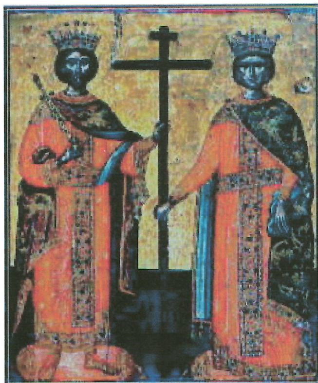
Εικόνα 2 Άγιος Κωνσταντίνος, Αγία Ελένη (Βυζαντινό Μουσείο Αθηνών β' μισό του 17 ου αιώνα).