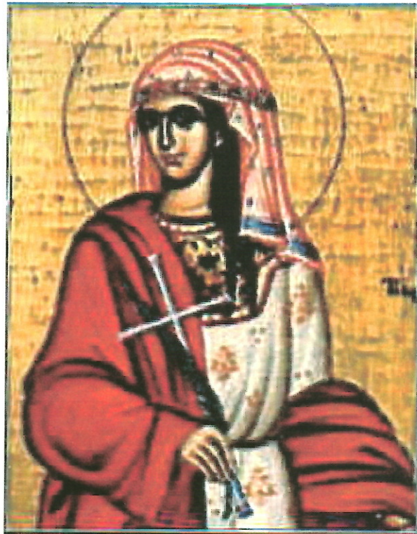
εικόνα 3 Αγία Γλοκερία (Μονή Κοιμήσεως της Θεοτόκου Πάρνηθος)