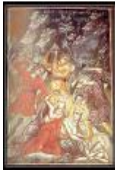
Οι μάρτυρες την ώρα του μαρτυρίου τους