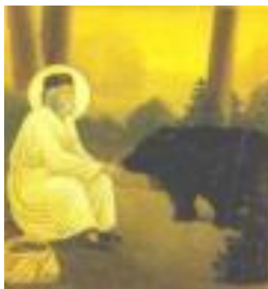
Ο Σεραφείμ του Σάροφ υπήρξε αντικείμενο βίας

προκαλέσουν. Η ανθρώπινη βία δεν τους τρόμαζε, γιατί δεν είχε υπόσταση, μπροστά στην πίστη τους και την εμπιστοσύνη τους για τον Χριστό. Οι μάρτυρες μας έδειξαν πως μπροστά στην βασιλεία των ουρανών τίποτα δεν μπορεί να σταθεί εμπόδιο ή να ανακόψει την πορεία τους προς την τελείωση. Η βία γι' αυτούς δεν έχει υπόσταση, δεν τους τρομοκρατεί. Οδηγός τους και συνοδοιπόρος τους ο Αρχιμάρτυς, το πρότυπο κάθε πιστού, ο Ιησούς Χριστός. Αυτός που ήρθε για να πονέσει, να πεθάνει για να σκοτώσει τον θάνατο μέσα από την ανάσταση.