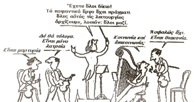
Το Ποιμαντικό έργο και οι λειτουργίες του ή κουαρτέτο εγχόρδων (ο διευθυντής ορχήστρας: συντονιστής – πορθμεύς)