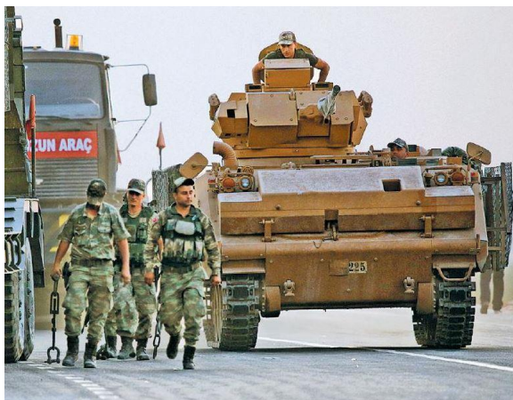
Εισβολή των Τούρκων στη Βόρεια Συρία. «Η Καθημερινή» 13.10.2019, σ. 1.

Υπάρχουν πάντα οι πρόθυμοι να παραλάβουν την σκυτάλη...