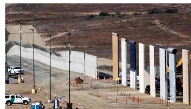
Το «Τείχος» του Τράμπ (στα σύνορα με το Μεξικό).

Αλέξανδρος Μ. Σταυρόπουλος (4 Νοεμβρίου 2019)