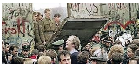
Η πτώση του Τείχους του Βερολίνου (9 Νοεμβρίου 1989).