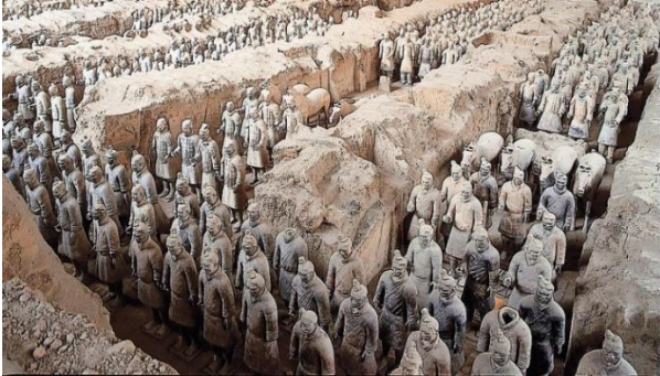
Ο πήλινος στρατός του Κιν Σιχουάνγκ Ντι, πρώτου αυτοκράτορα της Κίνας (259-210 π.Χ.).