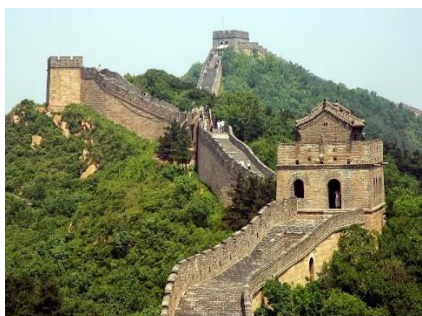
Σινικό Τείχος: μήκος 8.850 χλμ.

Κατά τα άλλα, εξακολουθούμε... όπως πάντα, να υψώνουμε ανάμεσά μας τείχη, τοίχους και φράκτες, έστω κι αν κάποια στιγμή γκρεμίζουμε και κάποιο τείχος !