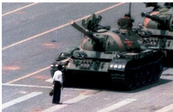
Πλατεία Τιέν Αν Μεν, Ιούνιος 1989 2 .